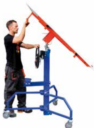
MONTÁŽ ZKOSENÉ STŘECHY